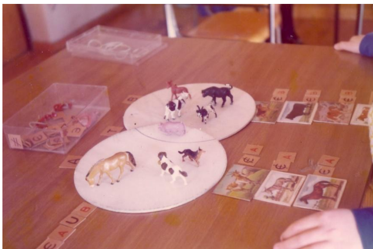
Εικόνα 5. Μοντεσσοριανό υλικό φτιαγμένο από τη Γουδέλη: Μαθηματικά – Σύνολα