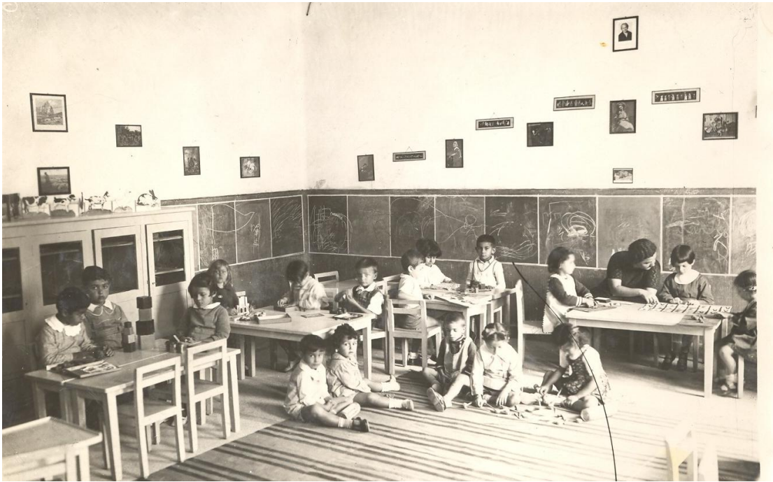
Εικόνα 3. Μοντεσσοριανό περιβάλλον στο νηπιαγωγείο της Μαρασλείου (1938)

μαθητές της αμέσως 19 . Ανταλλάχθηκαν επιστολές, με τη Μαρία Εδελστάιν να είναι ιδιαίτερα επίμονη, προκειμένου να ξεπεράσει εμπόδια στη μεταφορά και διέλευσης των υλικών αυτών από τα ελληνικά σύνορα. Δημιούργησε επίσης η ίδια μοντεσσοριανό υλικό σχετικά με την ελληνική γλώσσα, τον πολιτισμό και την ιστορία (Καλησπέρη, 2021). Τον Σεπτέμβριο του 1939, η Μαρία Εδελστάιν έγινε μέλος του Μοντεσσόρειου Συνδέσμου, για τον οποίο χρειάστηκε να δημιουργηθεί ειδικός φάκελος από το Υπουργείο Παιδείας και Θρησκευμάτων, με την έγκριση του Υπουργείου Ασφαλείας 20 .