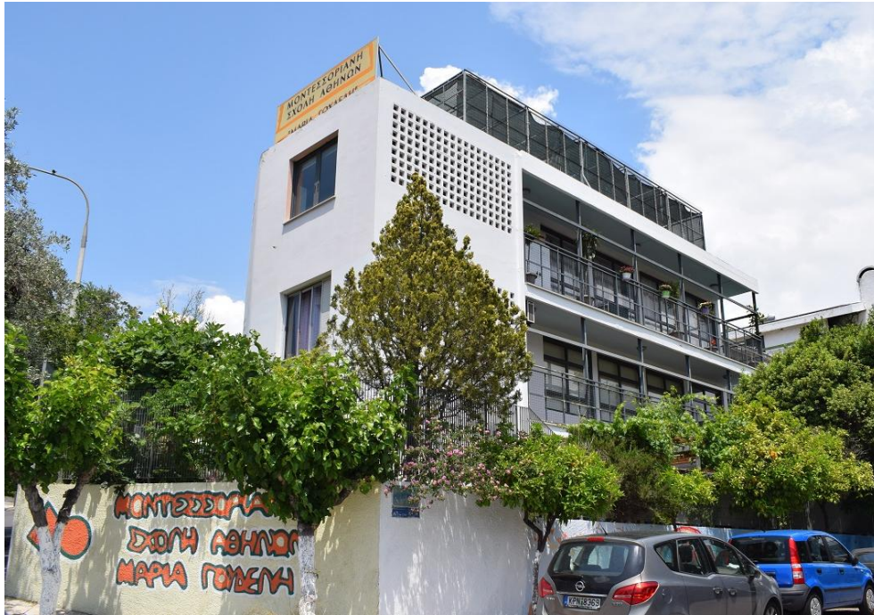
Εικόνα 4. Μοντεσσοριανή Σχολή Αθηνών Μαρία Γουδέλη

μοντεσσοριανού περιβάλλοντος, ώστε να καλύπτονται κι υποστηρίζονται πλήρως οι αναπτυξιακές ανάγκες των παιδιών 3-12 ετών (Κάτσιου-Ζαφρανά, 1995)