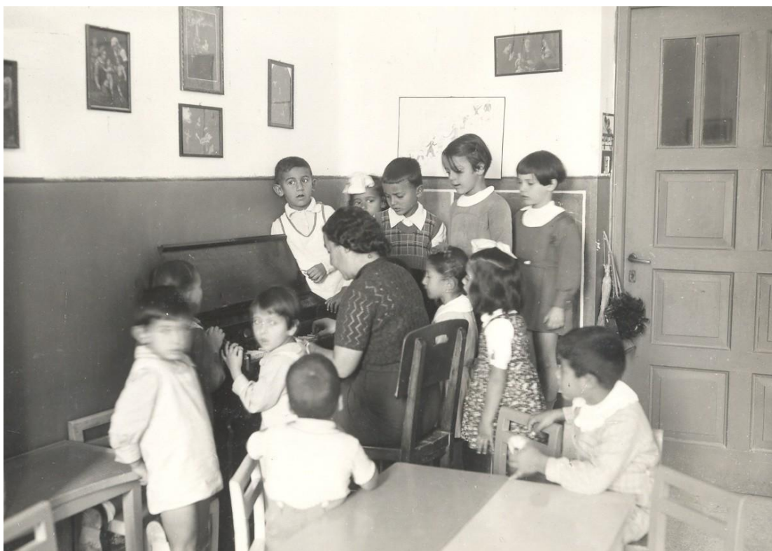
Εικόνα 2. Ιδιωτικό μοντεσσοριανό νηπιαγωγείο στο σπίτι των Γουδέλη (1950)

Πράγματι, το ακαδημαϊκό έτος 1949-1950 ξεκίνησε το δικό της ιδιωτικό μοντεσσοριανό σχολείο για παιδιά 3-6 ετών, στο σπίτι της στο Κολωνάκι, Αθήνα. Μέσα στο επόμενο ακαδημαϊκό έτος, 1950-1951, ίδρυσε και μοντεσσοριανό δημοτικό Σχολείο με τους αποφοίτους του νηπιαγωγείου της.